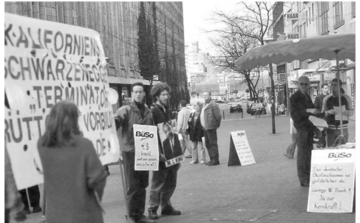
Im Landtagswahlkampf in Nordrhein-Westfalen setzt sich die BüSo (hier ein Informationsstand in Essen) als einzige Partei für die Reindustrialisierung des Ruhrgebiets ein. Auf dem großen Banner am linken Bildrand macht sie sich darüber lustig, daß CDU-Spitzenkandidat Rüttgers offensichtlich im kalifornischen Gouverneur Schwarzenegger sein neues politisches Vorbild ausgemacht hat.

Am 22. März zog GE Capital, das Finanzunternehmen von General Electric, Finanzierungszusagen für GM-Zulieferer in Höhe von zwei Milliarden Dollar zurück und signalisierte damit, daß sie die noch weitere mögliche Abwertung auf Ramschanleihestatus bei GM nicht aus-